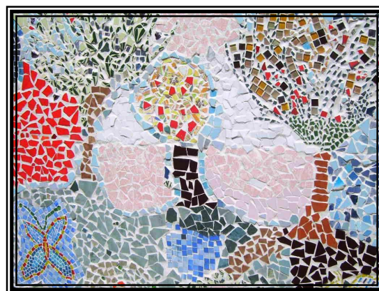
Détail de la fresque de Koekelberg